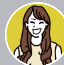
男の子ママ 通い始め4歳

息子のペースに合わせた支援で、10ヶ月かけて跳び箱と縄跳びができるようになりました！家族みんなが子どもの成長に感動し、幼稚園の先生も驚いていました。